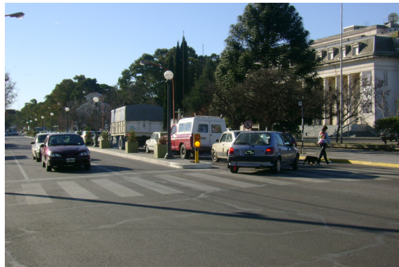
Imagen 5. Esquina de Avenida Alem y San Juan desde donde se puede observar el bulevar. Fotografía tomada por Emilce Heredia Chaz, junio de 2007.

A continuación, nos proponemos dar cuenta del modo en que dicho espacio urbano sirve como soporte para el desarrollo de un recorrido corporal que apunta a la internalización de una determinada representación vinculada con el poder. Este recorrido cobra significado tanto si nos trasladamos a través de las sendas peatonales, como si nos movilizamos por medio de un vehículo. Sin embargo, le prestamos