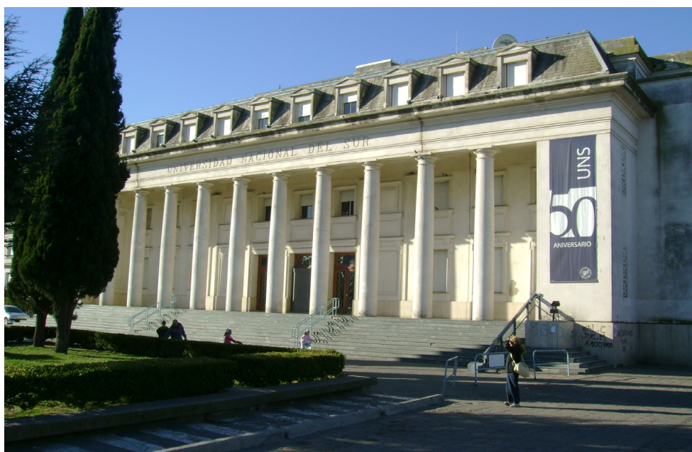
Imagen 4. Edificio central de la Universidad Nacional del Sur. Fotografía tomada por Emilce Heredia Chaz, junio de 2007.

E l cuerpo que recuerda. A través del recorrido trazado por cada uno de los elementos que conforman el área afectada por el proyecto de intervención urbana del gobierno de Cristian Breitenstein, resulta posible rastrear una común conexión entre todos ellos. En el trazado de la Avenida de las Sophoras, en el Monumento a los Fundadores, en el portal de ingreso al Parque de Mayo y en el edificio central de la Universidad Nacional del Sur se encuentran presentes, de diversos modos, representaciones ca-