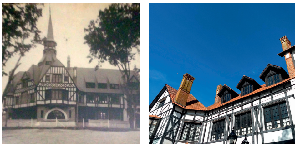
Figura 5. Rowing Club Argentino, aspecto original y actual.

En referencia a la postulación de Tigre, el entrevistado recuerda que el club había recibido una circular para sumarse a dicha nominación, pero no recordaba quién la había enviado. Además, el entrevistado ve como un hecho positivo que Tigre sea declarado finalmente Patrimonio de la Humanidad, ya que estaría preparado para recibir un aumento de visitantes, resaltando servicios como restaurantes y locales comerciales. Sin embargo, no hace referencia a los alojamientos. Siguiendo con la postulación, dice no percibir una “afectación inmediata” para los clubes de remo y sostiene: “no veo que nos puedan imponer nada derivado de ser patrimonio... Salvo que no permitan cambiar las fachadas, pero justamente, es lo que nosotros queremos [cuidar las fachadas]” (E.3), en referencia a la voluntad expresada por algunos representantes de los clubes acerca de modificar o hacer tareas de mantenimientos a los edificios sede de los clubes.