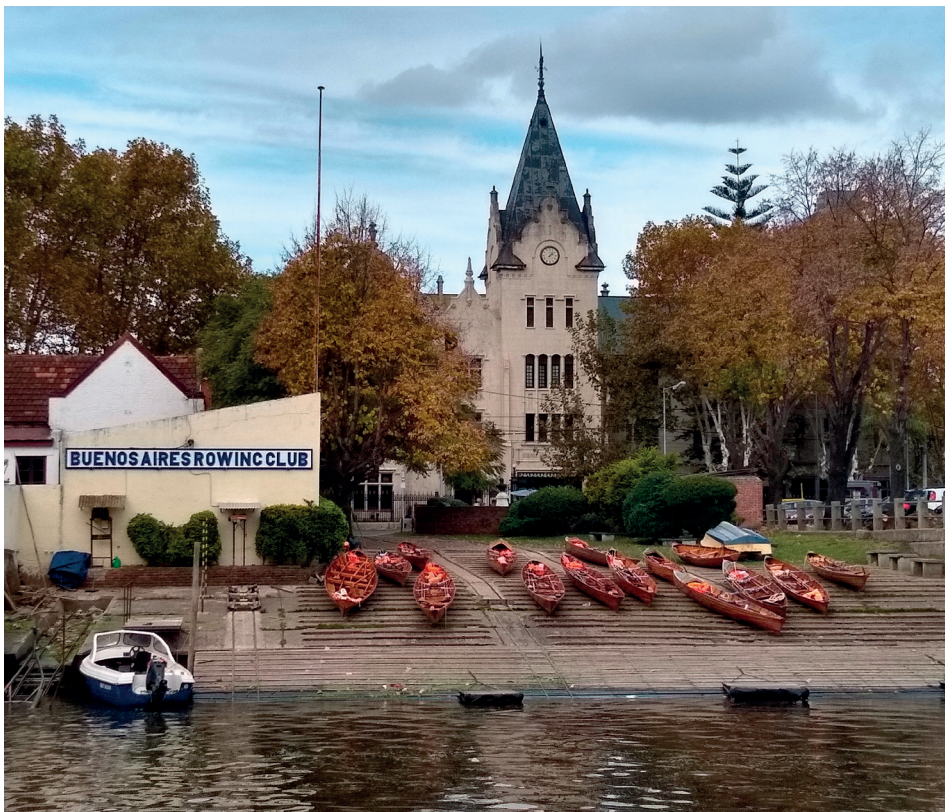
Figura 3. Buenos Aires Rowing Club. Vista desde el Río Tigre. Fuente: fotografía tomada por Leandro Becka (3 de mayo de 2019).

El primer club visitado fue el Buenos Aires Rowing Club (Fig. 3). Fue fundado en 1873 por un grupo de jóvenes entre los que predominaban inmigrantes ingleses. Si bien la primera sede se encontraba en la ciudad de Buenos Aires, en 1876 se consideró apropiado trasladar la sede a Tigre, ubicándola sobre la calle Gral. Bartolomé Mitre, a orillas del Río Tigre. Cuando se le consultó al representante acerca de la “imagen” de Tigre, expresó que es un destino de “fin de semana” y argumenta que “hoy sólo con pararse en la puerta del club un fin de semana, uno ve un desfile de turistas y vecinos” (E.1). En este sentido, indica que el perfil de visitantes son mochileros que visitan las islas, europeos que se interesan por lo cultural, concluyendo que “hay mucha diversidad” (E.1). Además, sostiene que no ve en el visitante a un potencial socio para los clubes, si bien los clubes hacen un “aporte cultural hacia el visitante” (E.1). En lo que respecta a la nominación de Tigre para ingresar a la LIPMH, el representante muestra una posición a favor de esta. Dice haberse informado de la postulación a través del vínculo con el municipio y agrega que no ve impactos negativos en su concreción, sino que, destacando la historia del club, espera un mejor posicionamiento y visibilidad del deporte tanto dentro como fuera del país y entre otros deportes, dándole un “mayor crecimiento a Tigre” (E.1).