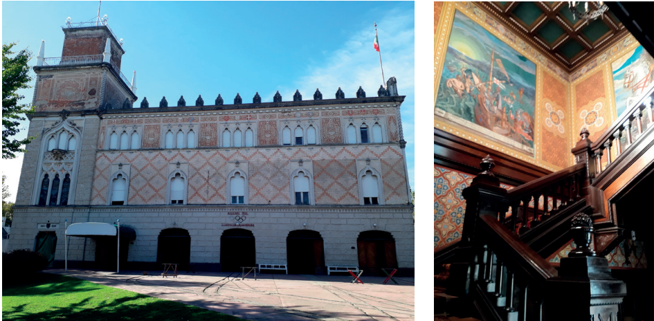
Figura 4. Galpón Veneciano del Club Canottieri y pinturas murales internas. Fuente: fotografía tomada por Leandro Becka (3 de mayo de 2019).

En referencia a la inclusión de Tigre en la LIPMH, el representante manifiesta no haber estado enterado de la postulación y piensa que la comunidad tampoco lo está. Agrega que no hicieron parte al club de dicha nominación. Sin embargo, le interesa que se declare Patrimonio de la Humanidad, aunque en ese caso considera necesario que el municipio brinde ayuda económica y guías. Además, el entrevistado agrega que: