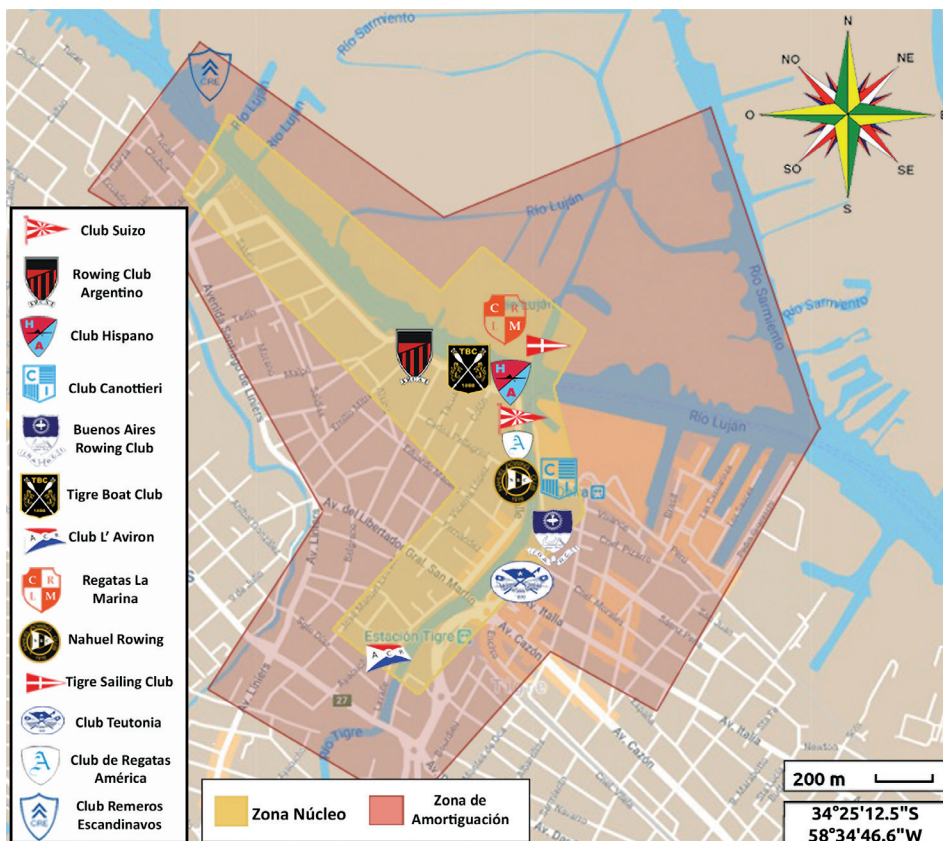
Figura 2. Distribución de clubes en el área postulada para la nominación UNESCO.