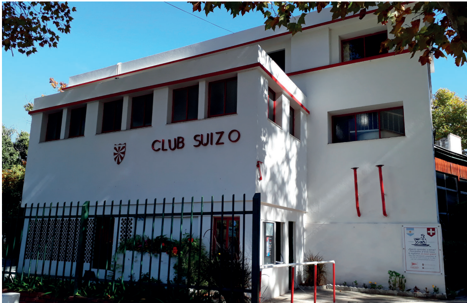
Figura 7. Frente del Club Suizo de Buenos Aires.