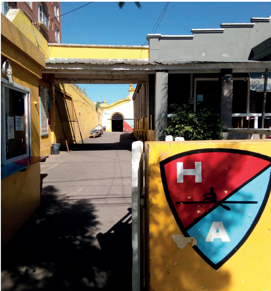
Figura 6. Deterioro del Club Regatas Hispano. Vista desde la calle.

la masa societaria” (E.4). En este sentido, y en relación con una de las estrategias impulsadas por el municipio, critica el programa “A Puertas Abiertas” por no dejar socios nuevos para la institución y por generar complicaciones para el club, puesto que implica el destino de personal del club, uso de vestuarios, entre otras cosas. De todas formas, el representante indica que se le solicitó al club fijar cartelera publicitaria en sus instalaciones, pero que, amén de ello, no existe una comunicación continua ni fluida con el municipio, destacando que esta situación “es un gran problema” (E.4). Por otro lado, reconoce que hay una falta de comunicación con el resto de los clubes. Además, agrega que tanto el municipio como la provincia deberían coordinarse con la Asociación Argentina de Remeros Aficionados para mejorar las pistas de remo, ya que están afectadas por la contaminación de las aguas.