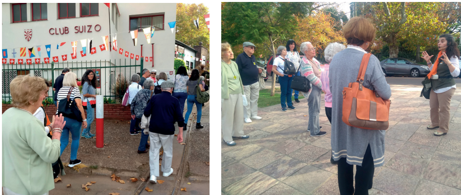
Figura 8. Visita guiada al Club Suizo. Programa “A puertas abiertas”.

El Centro de Guías de Turismo de Tigre y Delta del Paraná fue fundado en 1996 con la misión de hacer conocer, a través de sus visitas guiadas, capacitaciones y eventos culturales, el patrimonio natural, cultural, religioso, deportivo y ecológico del partido de Tigre 14 . Según señala la entrevistada, actualmente la vinculación del Centro de Guías con otros actores del territorio se da a través del ya mencionado programa “A Puertas Abiertas” (Fig. 8). El mismo prevé la realización de visitas guiadas todos los sábados a uno o dos clubes que se van alternando a lo largo del mes. Los clubes que están participando hasta el momento son Tigre Boating Club, Argentino Rowing Club, Club Suizo, Buenos Aires Rowing Club, Club Regatas Hispano Argentino y Club de Regatas La Marina, aunque la convocatoria permanece abierta para la incorporación del resto. La temática de las visitas está basada en la cultura del remo y en el impacto de los inmigrantes que se instalaron en el destino, haciendo hincapié en la cultura particular de cada club. El público que generalmente participa de estas visitas guiadas está conformado por visitantes provenientes de la ciudad de Tigre, en su mayoría por adultos mayores.