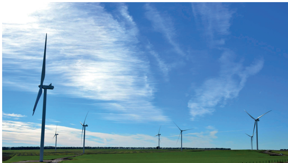
Figura 5. Parque eólico Corti, Bahía Blanca.

La mayoría de los proyectos eólicos de la región SUBA, tras la firma de los contratos con la Compañía Administradora del Mercado Mayorista Eléctrico (CAMMESA), han iniciado las tareas de construcción, aunque presentan distinto estado de avance. El 23 de mayo del 2018, el parque eólico Corti 14 se convirtió en el primero del RenovAR en inaugurarse. Localizado sobre 1.560 hectáreas rurales a la vera de la Ruta Provincial 51, a 20 kilómetros al noreste de Bahía Blanca, el parque cuenta con 29 aerogeneradores con una capacidad de producción de 100 MW (Fig. 5).