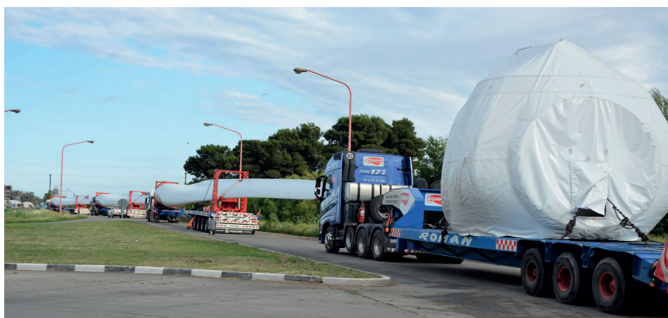
Figura 3. Operativo de traslado de equipamiento eólico por Ruta Nacional 3, noviembre 2017.

La existencia de infraestructura vial y portuaria y el buen acceso a redes de conexión eléctrica repercuten de manera favorable no solo en la logística que implica la construcción de los parques eólicos, sino también haciendo factible y más económica la inyección de la nueva energía generada. El análisis de estas tres condiciones presentes en la región SUBA permite identificar una sinergia 12 entre potencial eólico, localización e infraestructura y servicios, la cual se fortalece por la impronta o trayectoria del sur bonaerense a través de experiencias eólicas pioneras.