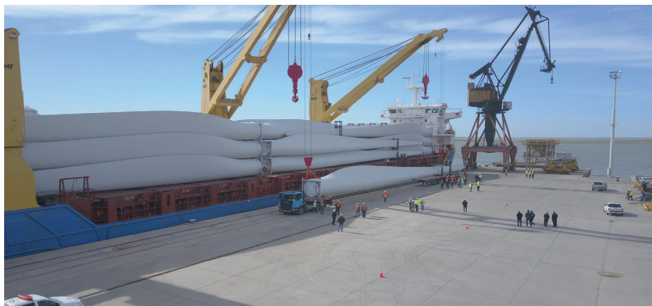
Figura 2. Recepción de las aspas de los aerogeneradores en el muelle multipropósito del Puerto Ingeniero White, octubre 2017.